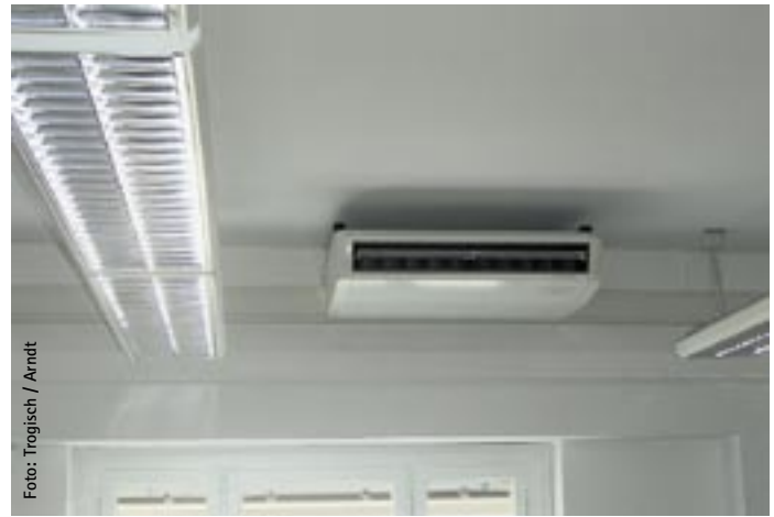
Bild 4 Einsatz von Unterdeckengeräten in einem Seminarraum (links falsche, rechts richtige Anordnung)