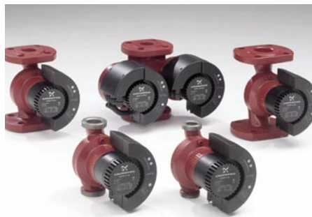
Grundfos: Die Baureihe Magna ist jetzt von DN 25 bis DN 65 komplett

Grundfos hat seine Magna-Baureihe mit neun neuen Pumpentypen im unteren Leistungsbereich komplettiert. Von der Rohrverschraubungspumpe DN 25 bis zur Flanschpumpe DN 65 stehen nun insgesamt 27 Typen mit Energieeffizienzklasse A, Permanentmagnetmotor, Anschluss-Stecker und selbst adaptierender Kennlinie zur Verfügung. Die in der Magna integrierte Automatik-Funktion macht in der Mehrzahl aller Praxisfälle eine Sollwerteingabe überflüssig. Die Pumpe sucht sich auf der Basis eines im Mikroprozessor vorgegebenen Algorithmus selbst den besten Sollwert. Die Pumpe fördert dann auf ihrer optimalen Kennlinie und damit am jeweils günstigsten Betriebspunkt. Fast alle Pumpen der Magna-Baureihe sind mit einem Gehäuse aus Edelstahl verfügbar und können so im Trinkwasserbereich eingesetzt werden.