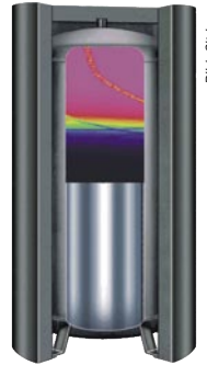
Citrin: Schichtladespeicher SLP

Citrin verspricht mit dem neuen Schichtladespeicher SLP schon nach kurzer Sonnenscheindauer warmes Trinkwasser durch eine obere „heiße Zone“. Laut Anbieter verhindert eine spezielle Anordnung von Strömungsbögen und Schichtladerohr Verwirbelungen und Vermischungen. Der Laderegler vergleicht außerdem die Speichertemperatur in mehreren Ebenen mit der Kolleortemperatur und schichtet die solaren Gewinne entsprechend ein. Der Speicher ist in Größen von 800 bis 1500 l erhältlich. Er ist auch für mehrere Wärmeerzeuger und mehrere Verbraucher gleichzeitig verwendbar.