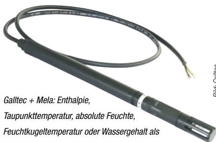
Galltec + Mela: Enthalpie, Taupunkttemperatur, absolute Feuchte, Feuchtkugeltemperatur oder Wassergehalt als Sensor-Analogsignal

Galltec + Mela 71149 Bondorf Telefon (0 74 57) 9 45 30 Telefax (0 74 57) 37 58 www.galltec.de