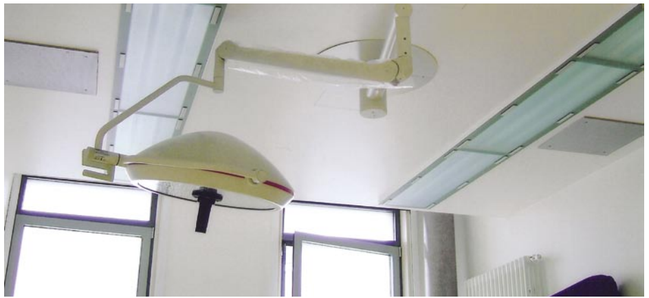
Rentschler Reven: Abgehängte Metalldecke in einer chirurgischen Krankenhausabteilung