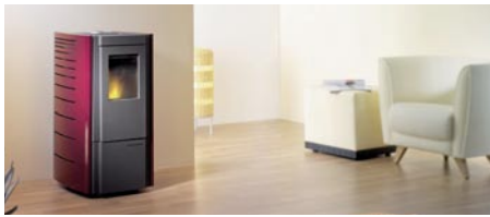
Calimax-Bellina: Farbgestaltung durch auswechselbare Seitenteile

Der Pelletofen Bellina mit 5 kW Heizleistung kann mit auswechselbaren Seitenteilen jeder Wohnungsgestaltung oder auch der Jahreszeit angepasst werden. Acht Farben sind lieferbar. Eine keramische Zündung, automatischer Start/Stopp sowie eine integrierte Raumtemperaturregelung bieten einen hohen Heiz- und Bedienkomfort. Dazu wurde ein futuristisch anmutendes Bedienmodul auf der Ofenoberseite platziert. Anschlüsse für handelsübliche Staubsauger und Reinigungsbürsten in den seitlichen Rauchgaszügen sollen die Reinigung und das Entfernen der Asche erleichtern.