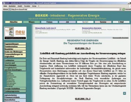
boxer99.de beinhaltet unter anderem eines der umfangreichsten Firmenverzeichnisse der Branche.

Aktuelles (Tagesmeldungen, Termine, Archiv ...), Wissen (Fachbücher, Gesetze, Grundlagen, Statistiken, Förderprogramme), Firmen (alphabetisch/thematisch sortiert), Job (Stellenangebote/-gesuche, Studiengänge, Weiterbildung), Suche (Google-Suche), Service (Volltextsuche, FAQ, Glossar ...).