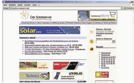
Plattform für alle, die sich intensiv mit Sonnenenergie beschäftigen: www.solarserver.de

Der Solarserver versteht sich als Plattform für alle, die sich intensiv mit Sonnenenergie beschäftigen. Zu den Inhalten gehören z.B. eine Einführung in die Solartechnik sowie ein Branchenführer, eine Zusammenstellung der Förderprogramme oder der Online-Solarstore. Eine Pinnwand für Jobs, Tipps und Fragen ergänzt das Angebot.