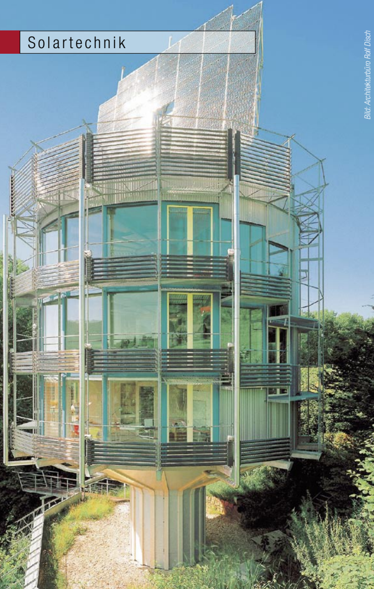
Das drehbare Solarhaus Heliotrop richtet sich immer ideal zur Sonne aus und zeigt was heute bereits beim Solaren Bauen möglich ist und wie die Zukunft aussehen könnte. Die Solarbranche boomt aber schon heute – das zeigt auch die Präsenz von Solar-Portalen im Internet.

Was Portale für Solarenergie und Solares Bauen bieten