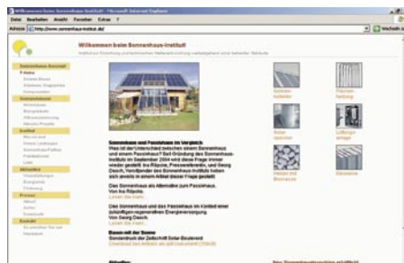
Das Sonnenhaus-Institut setzt auf solare Energiezugewinne.

Ziel dieses eingetragenen Vereins ist die Etablierung des „Sonnenhaus-Konzeptes“. Dazu zählen Häuser, die mehr als die Hälfte ihrer Warmwasser- und Heizenergie direkt aus der Sonne beziehen. Im Gegensatz zum Passivhaus wird auf stromverbrauchende mechanische Lüftungsanlagen verzichtet und auf den solaren Energiezugewinn gesetzt. Zu den Leistungen zählen die Information von Planern, Handwerkern und Bauherren.