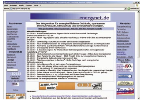
Internet-Wegweiser für die Bereiche Energie und Klimaschutz: www.energynet.de

Wer sich etwas breiter über regenerative Energien informieren will, findet in energynet.de einen idealen Internet-Wegweiser für die Bereiche Energie und Klimaschutz mit eigenen Informationen und Serviceangeboten. Planer, Handwerker oder Bauherren, die bestimmte Informationen suchen, sich neu mit einem der Themen beschäftigen möchten, Erfahrungsberichte, Nachrichten oder Hinweise zu Veranstaltungen suchen, werden hier fündig.