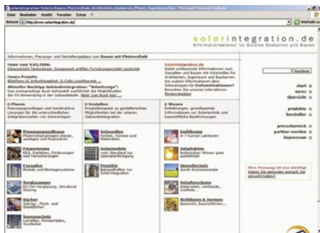
Umfassende Informationen rund um solares Gestalten und Bauen: www.solarintegration.de

Dieser Informationsdienst der Unternehmensvereinigung Solarwirtschaft (UVS) verspricht umfassende Informationen rund um solares Gestalten und Bauen für Architekten, Ingenieure, Handwerker und Bauherren- und das bietet er auch. Die Vielzahl der Themen und die Detailtiefe des Angebots ist beeindruckend. Die Rubriken Wissen, Gestalten und Bauen bieten Grundlagen-, Produkt- und Bautechnik-Informationen.