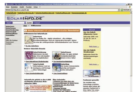
„Alles über Solarenergie“ verspricht solarinfo.de

„Alles über Solarenergie“ verspricht diese Seite gleich zu Beginn. Das ist natürlich etwas übertrieben, aber eine erstaunliche Bandbreite an Themen präsentiert diese Adresse schon. Insbesondere die Sprungmarken zu anderen Web-Seiten des gleichen Anbieters eröffnen dem Besucher ein zusätzliches Angebot. So offeriert solarkaufhaus.de ein reichhaltiges Sortiment solarbetriebener Gebrauchsgüter.