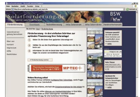
Online-Berater, dem kein Förderprogramm entgeht: www.solarfoerderung.de

Dieses von der Unternehmensvereinigung Solarwirtschaft (UVS) gemeinsam mit der KfW-Bankengruppe betriebene Portal ist eine Art Online-Berater für Solaranlagenbauer. Nach der Abfrage diverser Daten zur geplanten Solaranlage, wie Bundesland, Anlagenart, Gebäudeart etc. werden für die gewählte Konfiguration regionale Förderprogramme genannt. Für Bauherren wie Solarplaner gleichermaßen interessant.