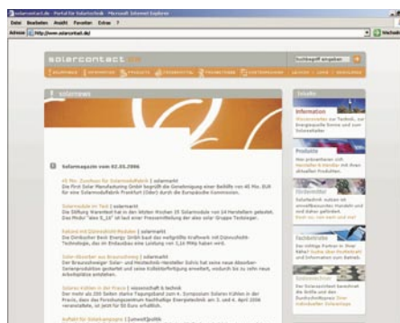
Solarcontact.de offeriert Information, Produkte, Fördermittel, Fachbetriebe und einen Kostenrechner.

Information, Produkte, Fördermittel, Fachbetriebe und ein Kostenrechner – das sind kurz zusammengefasst die wichtigsten Inhalte von solarcontact.de. Neben aktuellen Branchen-Nachrichten enthält die Seite viele Basisinformationen zur Photovoltaik und Solarthermie. Einen Überblick über Händler und Hersteller sowie Fachbetriebe für Solartechnik bieten die Rubriken Produkte und Fachbetriebe.