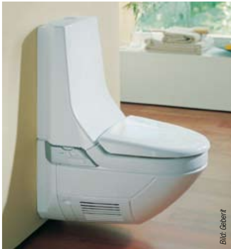
Geberit: Wandhängendes Dusch-WC Balena 8000 AP. Ausfahrbarer Duschstrahl und Warmluftfön.

Geberit 88630 Pfullendorf Telefon (0 75 52) 9 34 10 11 Telefax (0 75 52) 93 48 66 www.geberit.de