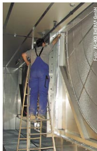
VDI 6022: Planung und Herstellung von RLt-Geräten sind eng verbunden