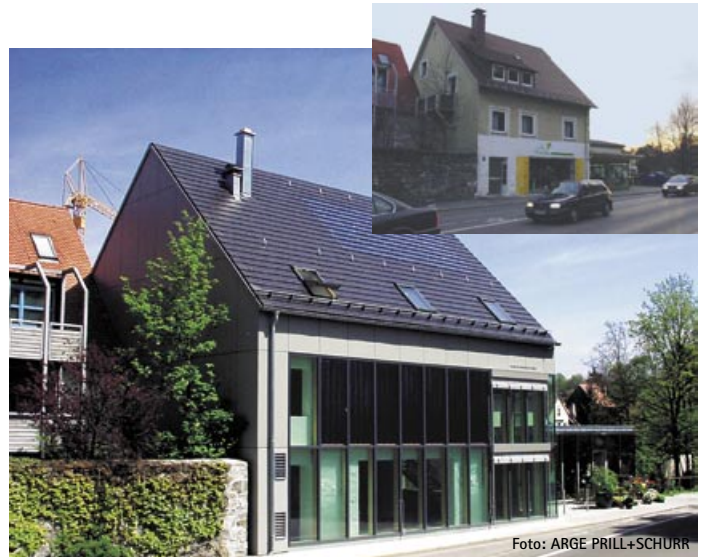
Aus Alt mach Neu: Energiebedarf um den Faktor zehn reduziert