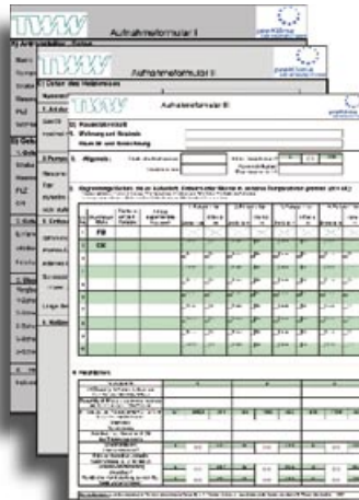
Werkzeug für die Optimierung von Heizungsanlagen im Bestand