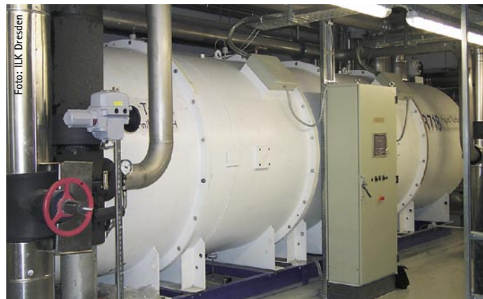
High-Tech-Zylinder: Zwei Radial-Verdichter mit Laufschaufeln aus Kohlefaser-Werkstoff bestimmen die Optik eines R718-Turbo-Kaltwassersatzes