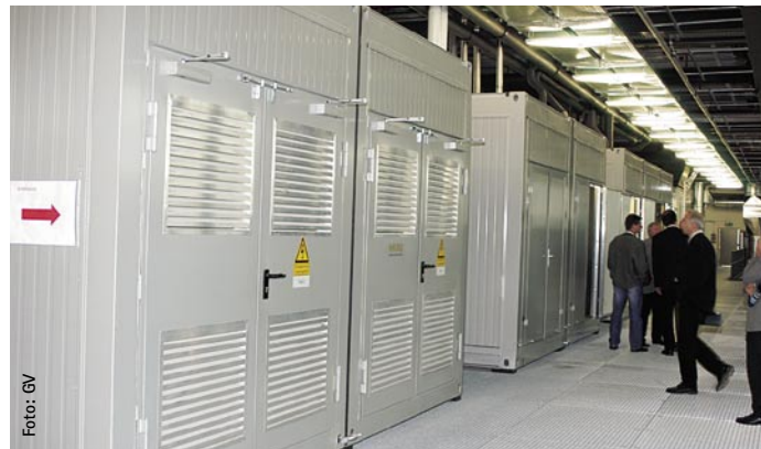
Technische Gebäudeausrüstung im Container? Vorteile durch Modulvorfertigung